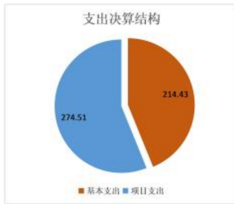
(图3：支出决算结构图)

2020年本年支出合计488.95万元，其中：基本支出214.43万元，占43.86%；项目支出274.51万元，占56.14%；上缴上级支出0万元，占0%；经营支出0万元，占0%；对附属单位补助支出0万元，占0%。