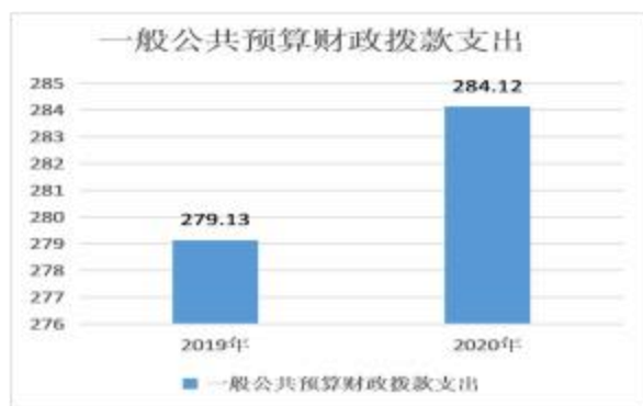
(图5：一般公共预算财政拨款支出决算变动情况)

2020年一般公共预算财政拨款支出284.12万元，占本年支出合计的58.11%。与2019年相比，一般公共预算财政拨款增加4.99万元，增长1.79%。与上一年度基本持平。