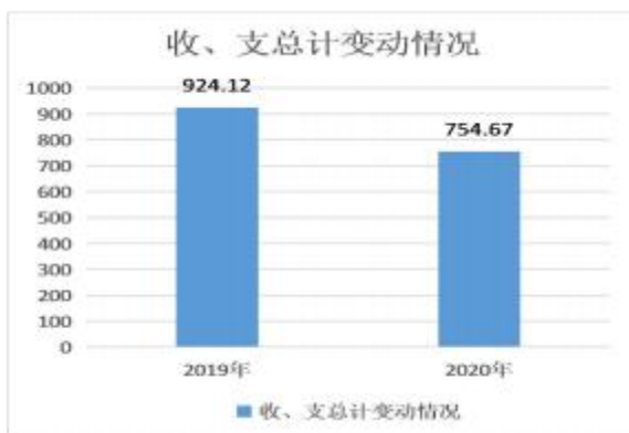
(图 1：收、支决算总计变动情况图)

总计各减少 169.45 万元，下降 18.34%。主要变动原因是本年受疫情影响，工作开展较晚，且部份外出工作安排作出调整，相关费用支出相应减少。