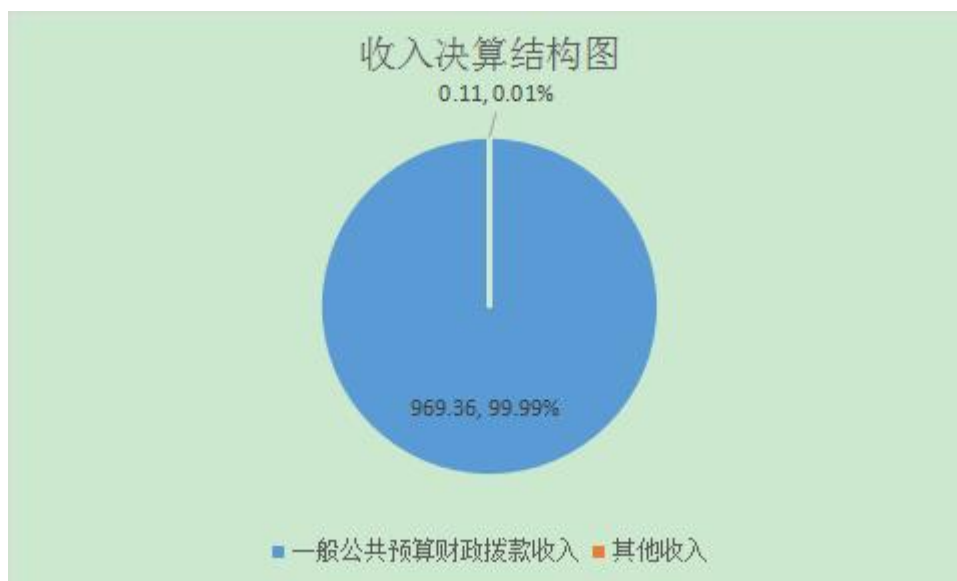
(图 2: 收入决算结构图)