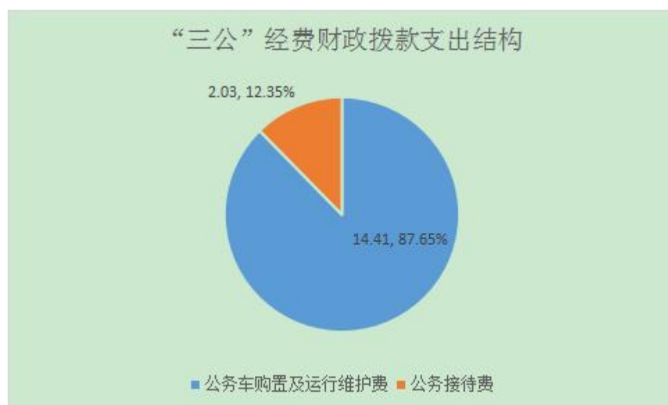
(图 7: “三公”经费财政拨款支出结构)

2021年度“三公”经费财政拨款支出决算中：因公出国（境）费支出决算0万元，占0%；公务用车购置及运行维护费支出决算14.41万元，占87.65%；公务接待费支出决算2.03万元，占12.35%。具体情况如下：