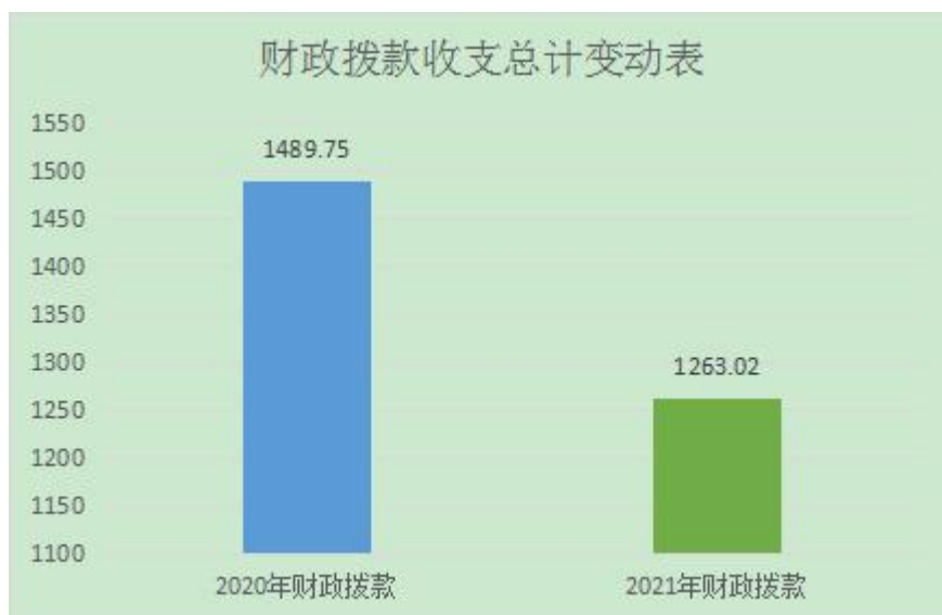
(图4：财政拨款收、支决算总计变动情况)

2021年财政拨款收、支总计1263.02万元。与2020年相比，财政拨款收、支总计各减少226.73万元，下降15.22%。主要变动原因是人员减少，相对应的人员经费支出和公用经费支出减少。