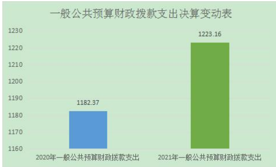
(图 5: 一般公共预算财政拨款支出决算变动情况)