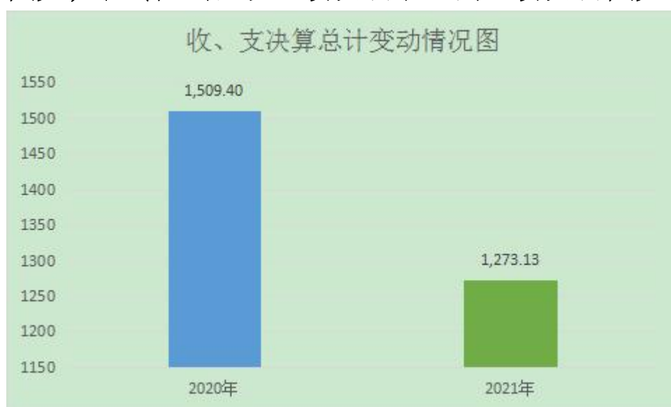
(图1: 收、支决算总计变动情况图)

2021年度收、支总计1273.13万元。与2020年相比，收、支总计各减少236.27万元，下降16%。主要变动原因是人员减少，相对应的人员经费支出和公用经费支出减少。